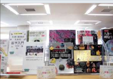
② 新着図書コーナー