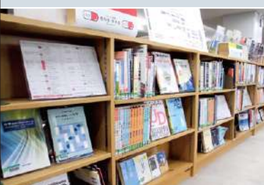
⑤ 学年別教科書・参考書コーナー