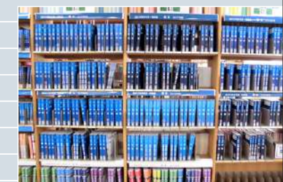
⑧ 国試問題集コーナー